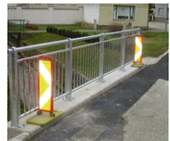
Brückengeländer in Fallbach