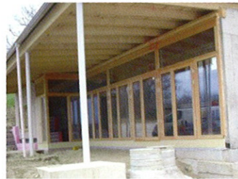
Gemeinschaftshaus in Fallbach