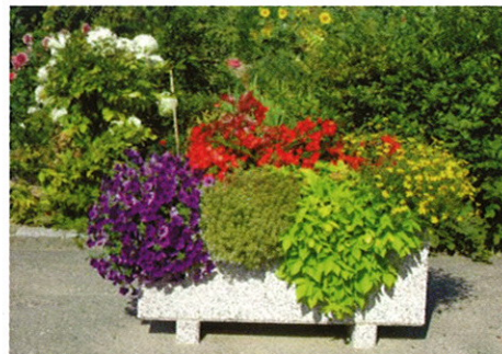
Blumenschmuck in Friebritz