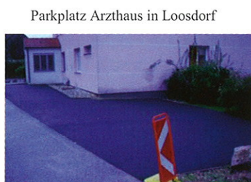
Parkplatz Arztshaus in Loosdorf