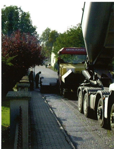
Asphaltierungsarbeiten in Hagendorf