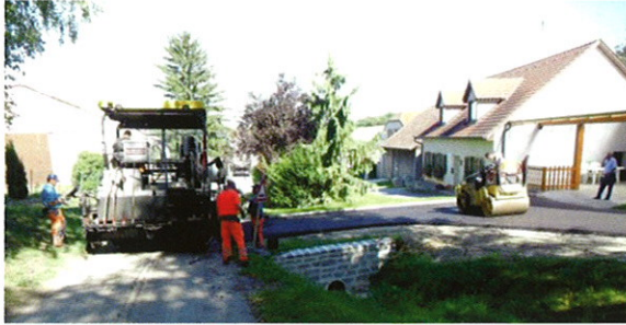
Asphaltierungsarbeiten in Fallbach