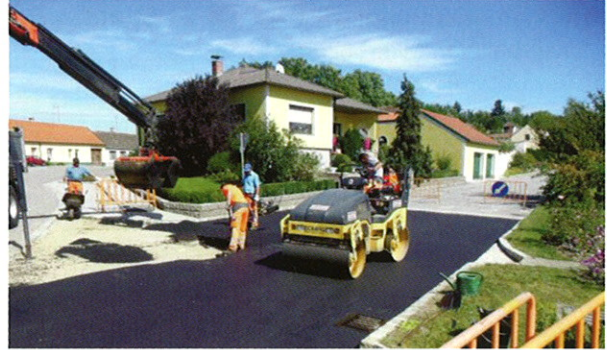
Asphaltierungsarbeiten in Fallbach