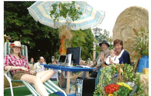
Anhänger der Gemeinde Fallbach beim Erntedankfest Asparn - Landesausstellung