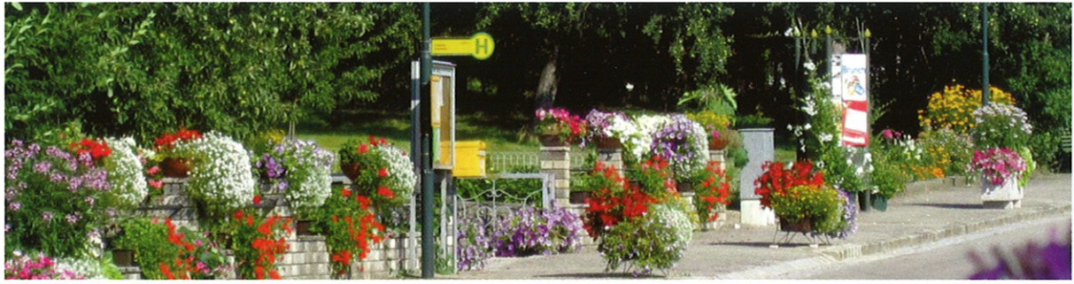
Blumenschmuck in Friebritz,